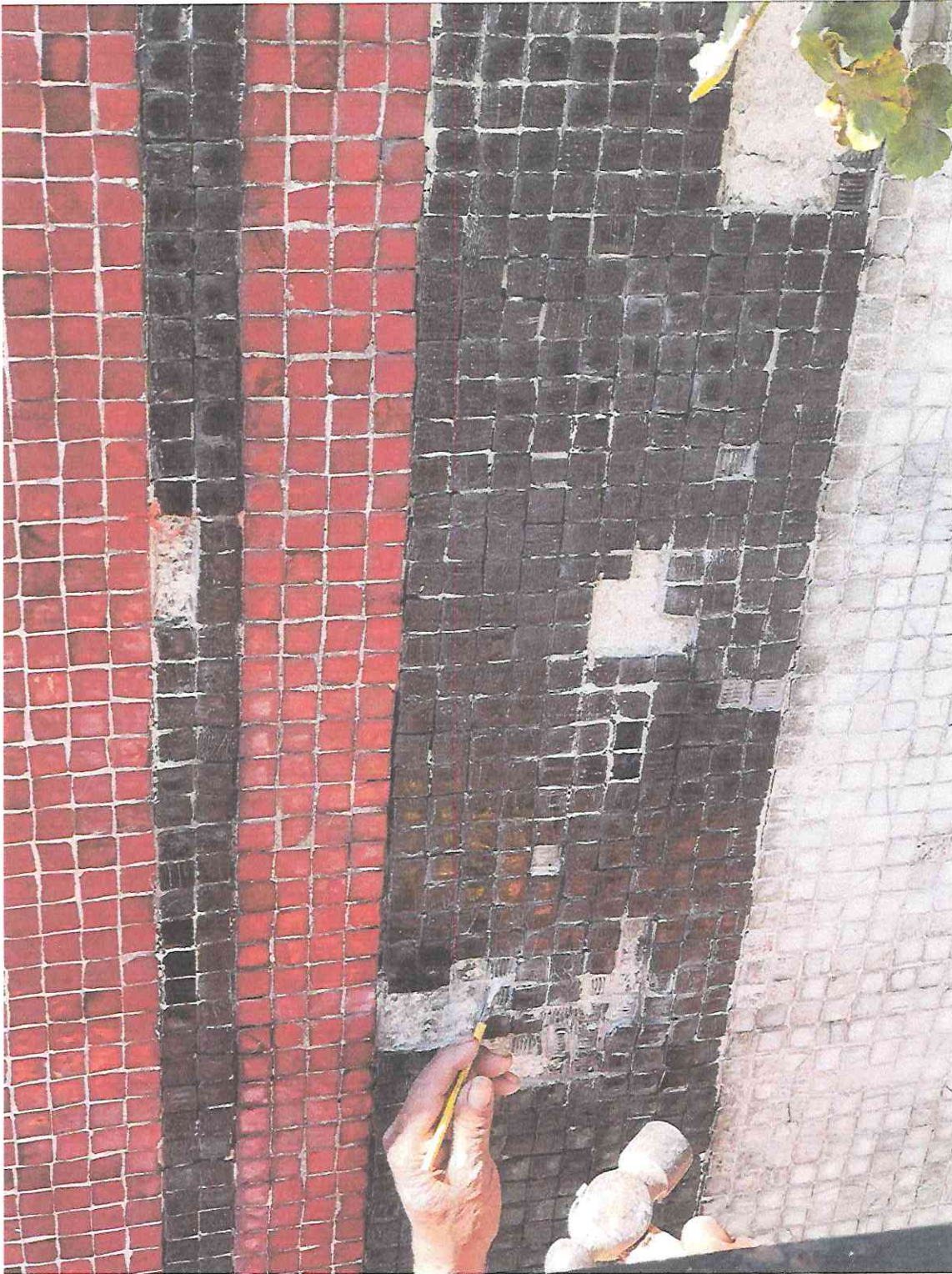
TRABAJOS DE LIBERACIÓN DE AGREGADOS EN PARTE DE MUROS DEL INGRESO DEL TEATRO DE CÁMARA – SEGMENTO TC