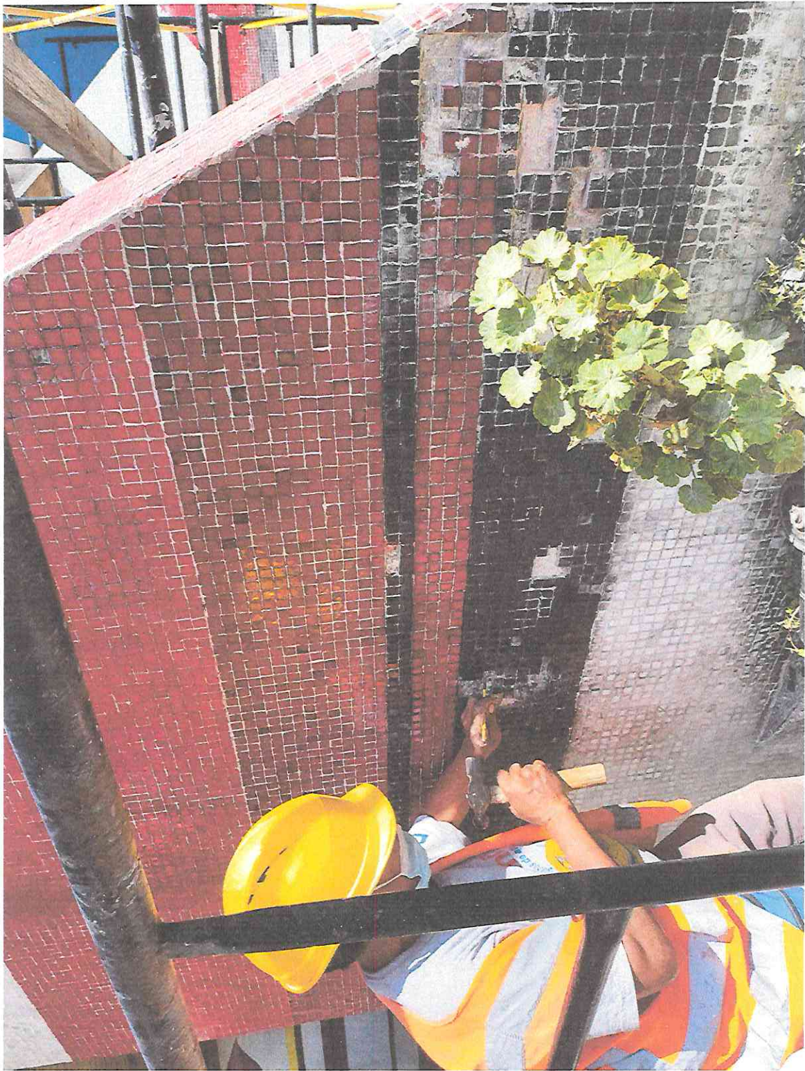
TRABAJOS DE LIBERACIÓN DE AGREGADOS EN PARTE DE MUROS DEL INGRESO DEL TEATRO DE CÁMARA – SEGMENTO TC